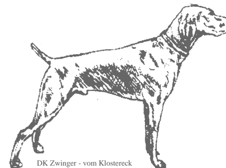
DK Zwinger - vom Kloostreck