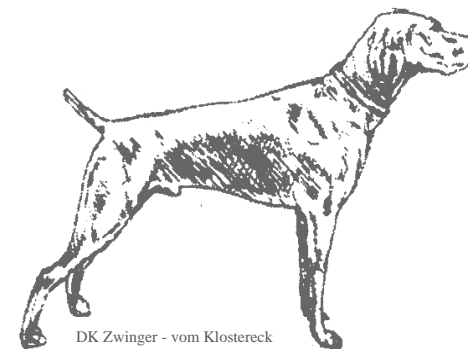
DK Zwinger - vom Klostereck