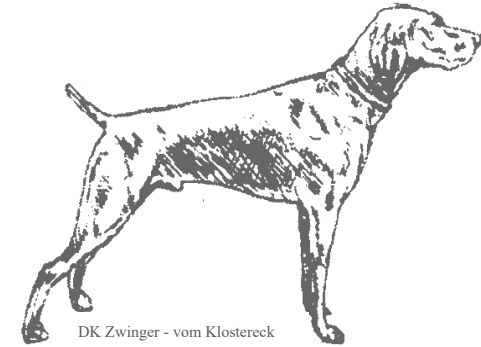
DK Zwinger - vom Klostereck