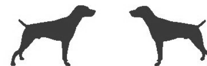
DK Zwinger - vom Klosterreck DTK Zwinger - vom Wiesbachtal